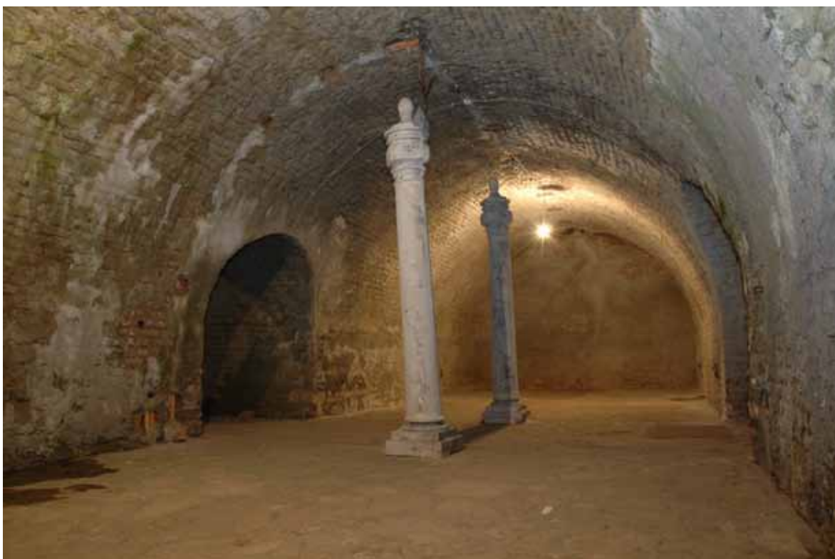
Постојеће стање унутрашњег простора казамата