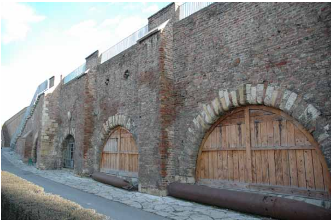
Постојећи изглед казамата